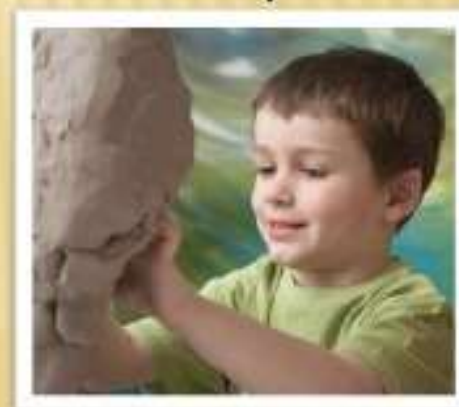
занятия с глиной