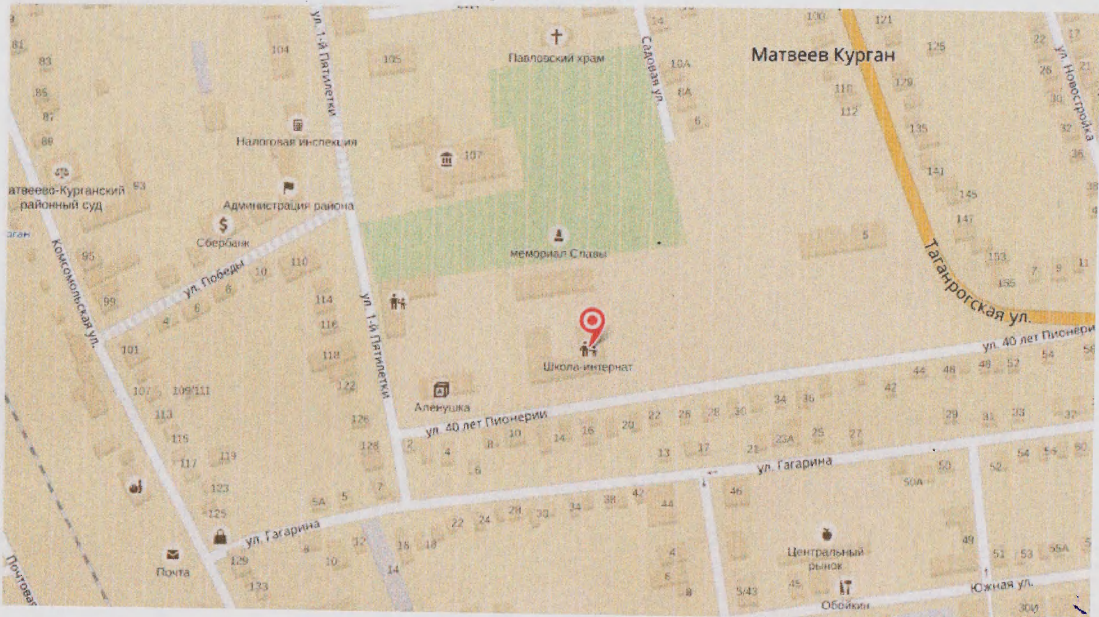
Схема организации дорожного движения в непосредственной близости от образовательного учреждения с размещением соответствующих технических средств, маршруты движения детей и расположение парковочных мест